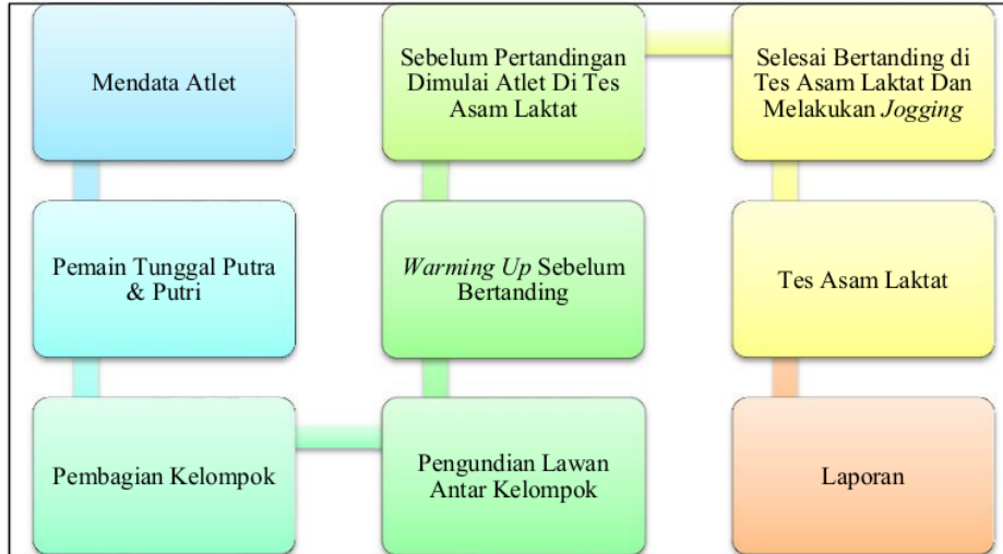
Gambar 2. Proses Pengambilan Data

Hasil kadar asam laktat saat permainan bulutangkis tidak berbeda jauh dengan beberapa penelitian sebelumnya. Penelitian sebelumnya menunjukkan bahwa kadar asam laktat permainan bulutangkis menghasilkan sekitar 4.70 mmol (Majumdar dkk.,1997), 3.8 mmol (Cabello & Gonzalez, 2003) dan 6.8 mmol (Faude dkk., 2007). Hal ini menunjukkan bahwa bulutangkis merupakan salah satu olahraga yang menggunakan gabungan antara aerob glikolisis dan anaerob glikolisis (Cabello & Gonzalez, 2003; Faude dkk., 2007). Asam laktat yang dihasilkan selama pertandingan bisa dihilangkan atau diturunkan pada saat istirahat setiap sesudah rally (mendapatkan poin) atau setiap perpindahan set. Rata-rata waktu istirahat 11 detik setelah rally (Faude dkk., 2007). Oleh sebab itu, pemulihan dengan jogging tidak bisa dilakukan saat pertandingan berlangsung. Pemulihan ini dapat dilakukan pada saat setelah melakukan latihan maksimal dan setelah pertandingan berlangsung untuk persiapan pertandingan berikutnya pada keesokan harinya.