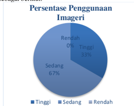
Gambar.2 Diagram presentase Kuisinoer Imageri Atlet Petanque Sumenep

Berdasarkan tabel.2 di atas diketahui penggunaan imagery pada saat bertanding cabang olahraga petanque PORPROV ke VII Jawa timur secara keseluruhan 3 atlet masuk ke kategori tinggi dan 6 atlet masuk ke kategori sedang. Namun, lebih jelasnya berikut ini paparan mengenai presentase tinggi, sedang bahkan rendahnya penggunaan imagery pada saat bertanding atlet petanque Sumenep masing-masing indikator dpat di lihat dalam diagram lingkaran sebagai berikut: