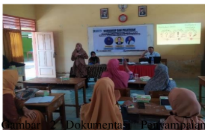
Gambar 2 Dokumentasi Penyampaian Materi Kedua

tim fasilitator Projek Penguatan Profil Pelajar Pancasila, 2) mengidentifikasi tingkat kesiapan satuan pendidikan, 3) merancang dimensi, tema, dan alokasi waktu Projek Penguatan Profil Pelajar Pancasila, 4) menyusun modul proyek, dan 5) merancang strategi pelaporan hasil proyek. Berikut dokumentasi penyampaian materi pemateri kedua.