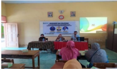
Gambar 1 Dokumentasi Penyampaian Pemateri Pertama

pemecahan masalah dan mengaplikasikan ilmu lintas disiplin kepada peserta didik. Peserta kegiatan terlihat mendengarkan dan secara aktif bertanya tentang bagaimana pencapaian Profil Pelajar Pancasila khususnya jika sumber daya manusia terbatas dan fasilitas tidak mendukung. Pemateri menjawab seluruh pertanyaan peserta kegiatan dengan baik dan memberikan solusi terbaik yang dapat dilakukan oleh Bapak/Ibu guru dalam proses pembelajaran. Berikut dokumentasi penyampaian materi pemateri pertama.