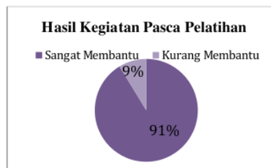
Gambar 4 Diagram Hasil Kegiatan Pasca Pelatihan

Berdasarkan dari hasil kuesioner dari 23 peserta setelah selesai mengikuti kegiatan PKM Workshop dan pelatihan memperoleh sebesar 83% peserta mengatakan dapat memahami materi dengan baik dan 17% peserta kurang memahami materi yang disampaikan oleh pemateri. Berdasarkan hasil angket juga diketahui bahwa 91% peserta/guru menjawab kegiatan PKM melalui kegiatan Workshop dan pelatihan tentang Penguatan Profil Pelajar Pancasila melalui Pendekatan PjBL sangat membantu dalam mengimplementasikan pembelajaran di sekolah, sedangkan 9% menjawab kurang membantu. Dapat diperoleh temuan bahwa kegiatan pengabdian kepada masyarakat di SDN Palongan melalui kegiatan Workshop dan pelatihan tentang “Penguatan Profil Pelajar Pancasila melalui Pendekatan PjBL” mudah dipahami oleh peserta serta dapat memberikan dampak perubahan lebih baik, sehingga sangat membantu guru untuk dapat mengimplementasikan Projek Penguatan Profil Pelajar Pancasila dalam sekolah dengan baik dan efisien.