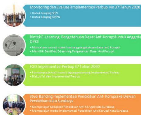
Gambar 1 : Tahapan Kegiatan DPKS dalam Mengawal Pendidikan Anti Korupsi

Sumber : Data dianalisis dari hasil wawancara dan riset dokumen DPKS 2020