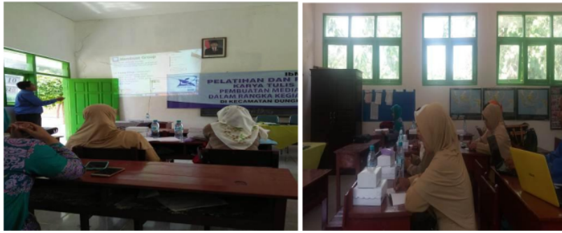
Gambar 3. Pelatihan-Pelatihan untuk Meningkatkan Keterampilan Guru SDN Romben Rana dan SDN Lapa Lao' II

Pelatihan Kedua terkait dengan sosialisasi pembuatan media pembelajaran berbasis IT, dalam hal ini media yang digunakan oleh Edmodo. Edmodo adalah platform pembelajaran yang aman bagi guru, siswa dan sekolah berbasis social media. Edmodo menyediakan cara aman dan mudah bagi kelas untuk terhubung dan berkolaborasi, berbagi konten dan akses pekerjaan, nilai dan pemberitahuan sekolah. Tujuan Edmodo adalah untuk membantu pendidik atau guru memanfaatkan kekuatan media social untuk menyesuaikan kelas untuk setiap pelajar. Pelatihan selanjutnya yaitu terkait dengan pelatihan penulisan karya ilmiah.