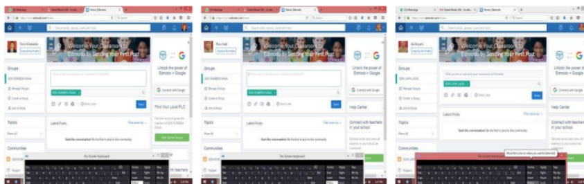
Gambar 5. Aplikasi Edmodo yang dimiliki oleh Guru-Guru di SDN Lapa Lao' II