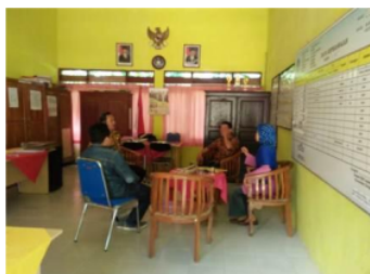
Gambar 1. Kegiatan Pra Pengabdian, Mengunjungi Lokasi Kedua Mitra

Pada proses pelaksanaan pengabdian tanggal 6 Agustus 2016, Pertama Tim Pengabdian memberikan bantuan media pembelajaran pada masing-masing sekolah berupa; a) satu unit komputer dengan merk LGb b); Printer Cannon; c) LCD; d) Proyektor; dan d) Mife merk Bolt.