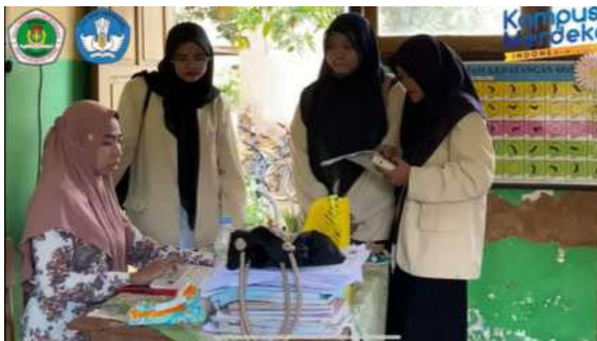
Dokumentasi Observasi dengan guru