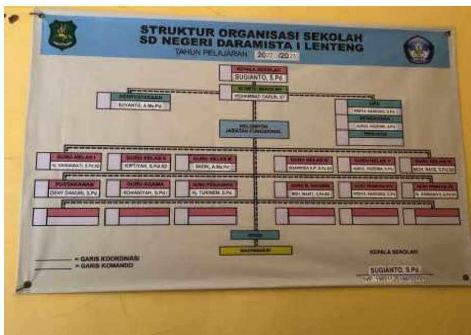
Dokumentasi Struktur Organisasi dan Tata Kerja