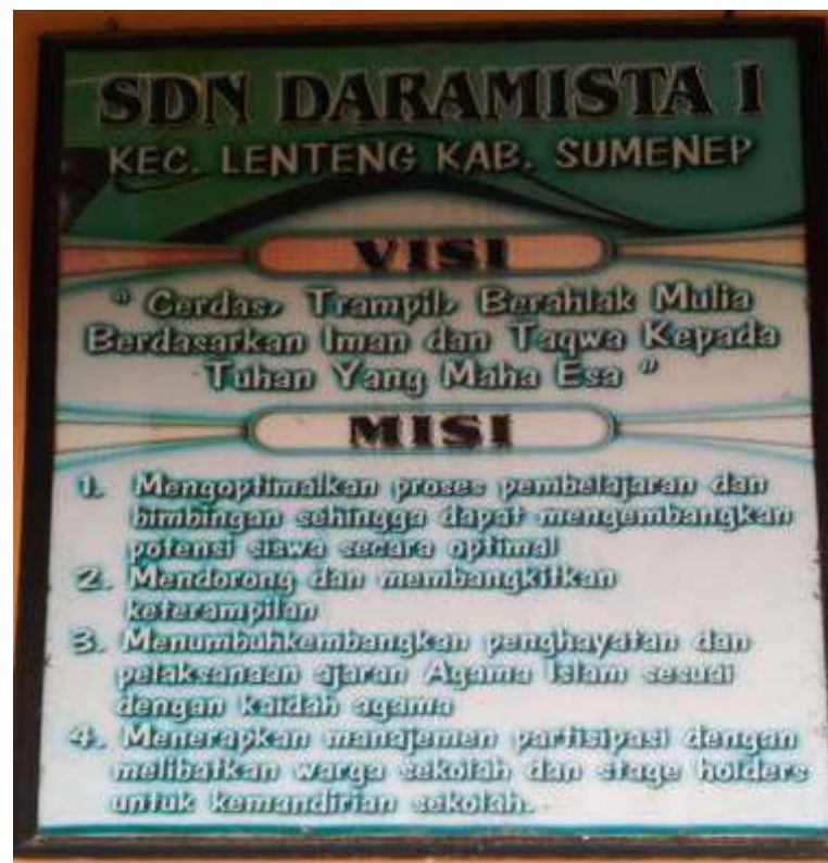
Dokumentasi Visi dan Misi