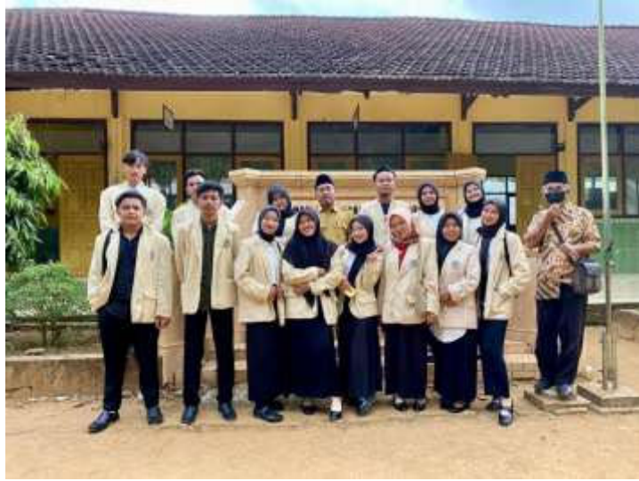
Penyerahan mahasiswa oleh DPL dalam kegiatan PLP 2023 di SDN DARAMISTA I