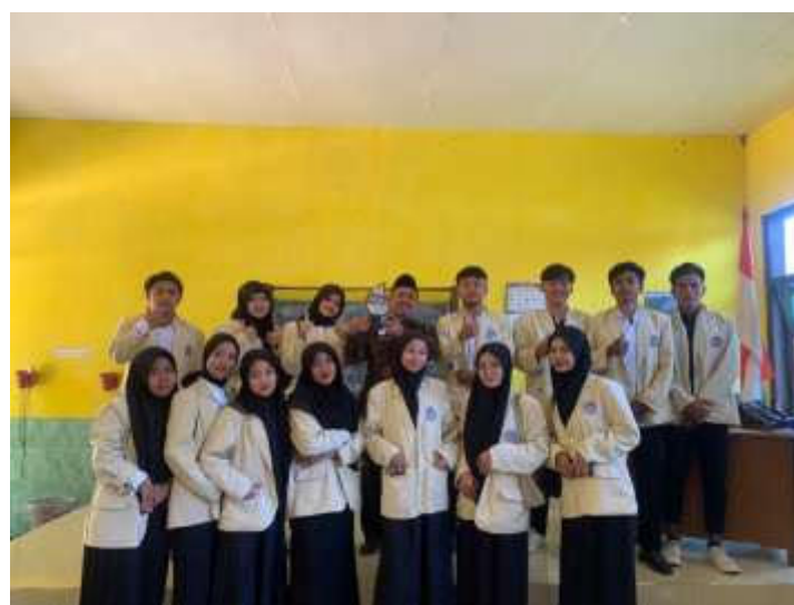
Dokumentasi pelepasan PLP di SDN DARAMISTA I