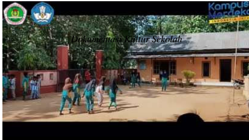
Dokumentasi Kultur Sekolah