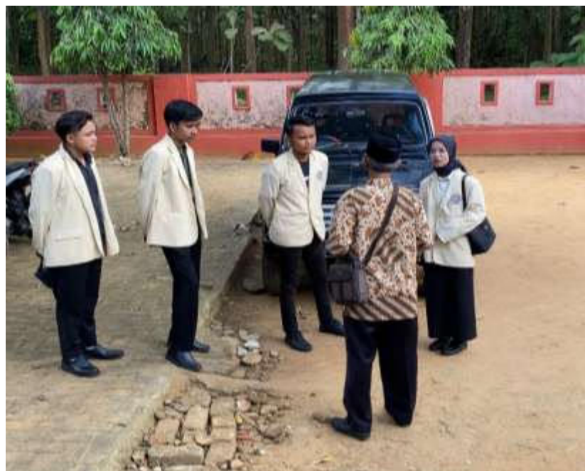
Dokumentasi observasi lapangan