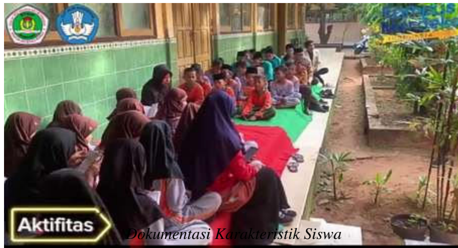
Dokumentasi Karakteristik Siswa