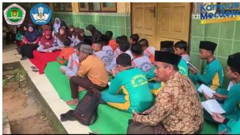
Dokumentasi Karakteristik Siswa