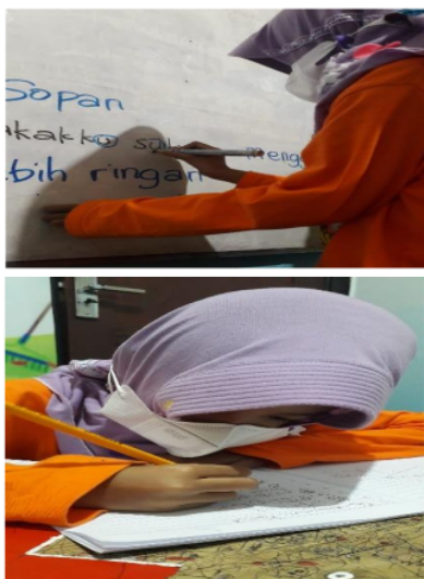
Gambar 4 Proses Pembelajaran di RBUS

Hal yang sama juga dilakukan oleh semua orang tua siswa, yaitu dengan mengisi angket. Dimana angket yang diberikan untuk dapat mengetahui tingkat keberhasilan kegiatan pendampingan ini. Pengamatan difokuskan kepada motivasi belajar dan hasil belajar siswa selama dan setelah mengikuti pendampingan.