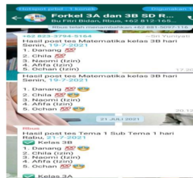
Gambar 3. SOP Pembelajaran di RBUS dan salah satu hasil belajar siswa

mengikuti pembelajaran dirumah. Pada masa covid-19 ini banyak factor penghambat serta terdapat berbagai bentuk keterbatasan salah satu diantaranya yaitu masalah bahan ajar. Dimana dalam hal ini ada beberapa siswa yang tidak memiliki bahan pembelajaran atau buku pelajaran sehingga sumber belajar sangat sedikit, tentunya dalam hal ini bisa berdampak terhadap menurunnya prestasi serta kualitas belajar siswa.