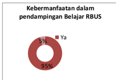
Gambar 5. Diagram Lingkar kebermanfaatannya dalam Pendampingan belajar RUBS

Berdasarkan data dari hasil angket yang diberikan ditemukan beberapa fakta yang tersaji dalam diagram ini.