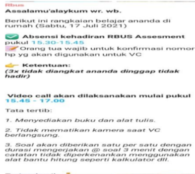
Gambar 2 Flyer pada RBUS sebagai solusi dimasa pandemi